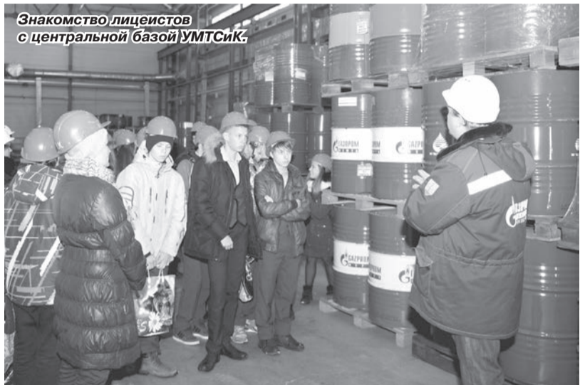
Знакомство лицеистов с центральной базой УМТСИК.

Октябрьская встреча состоялась в рамках профориентационной работы, являющейся неотъемлемой частью Политики управления человеческими ре-