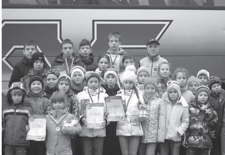
Команда чайковских горнолыжников клуба «Эдельвейс».